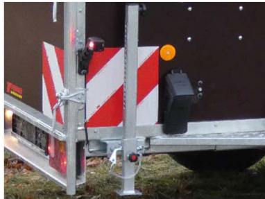
Schiebestützen Umrißbleuchten LED