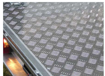
Bodenplatte mit Aluminiumriffelblech belegt