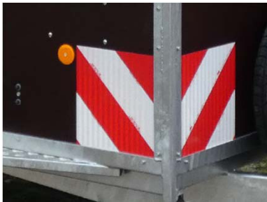
Warnmarkierung an den 4 Ecken