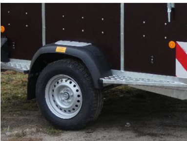
Auftritt aus Aluminium-Riffelblech, rechts hinten