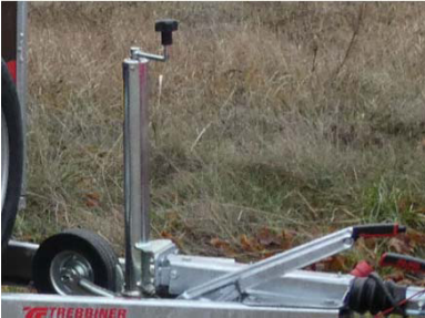
Automatikstützrad, montiert mittels Adapter direkt an Auflaufeinrichtung